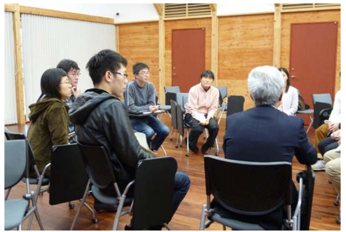
フリー・ディスカッション