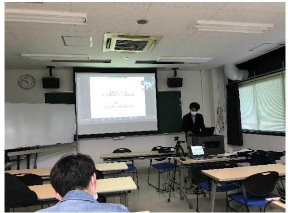
【石岡主任による説明】